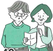
40歳以上の家族(被扶養者)が対象